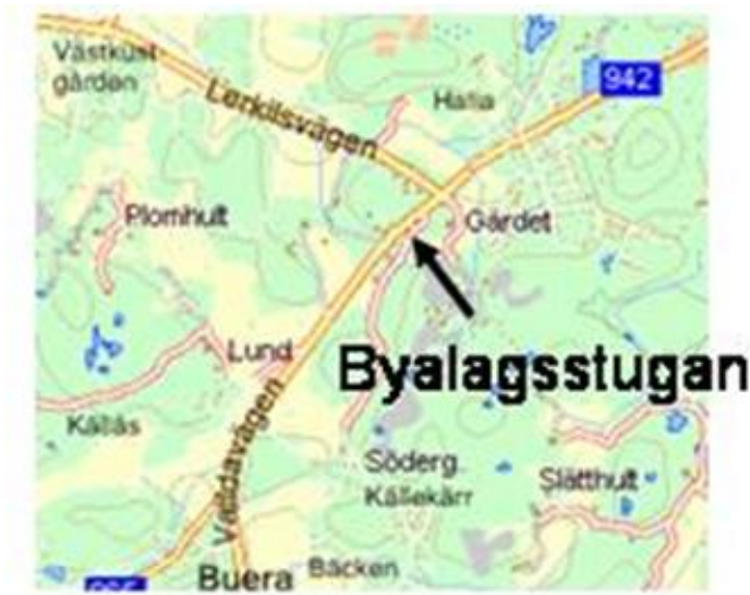
Figur 1. Byalagsstugan, Södergårdsvägen

Utöver ordinarie mötespunkter behöver stämman besluta om framtida, samt fördelningen av kostnaderna för, snöröjning, halkbekämpning och klippning av vägrenen, på Valldakorshamnsväg, Parkrosvägen, Rödkärsvägen och Rösevägen. Vägarnas sträckning framgår av kartan i figur 2. Ytterligare beskrivning av vägarna finns på http://nalleviksvagen.se/Roadmap.pdf .